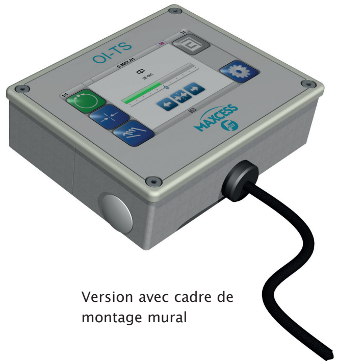
Version avec cadre de montage mural