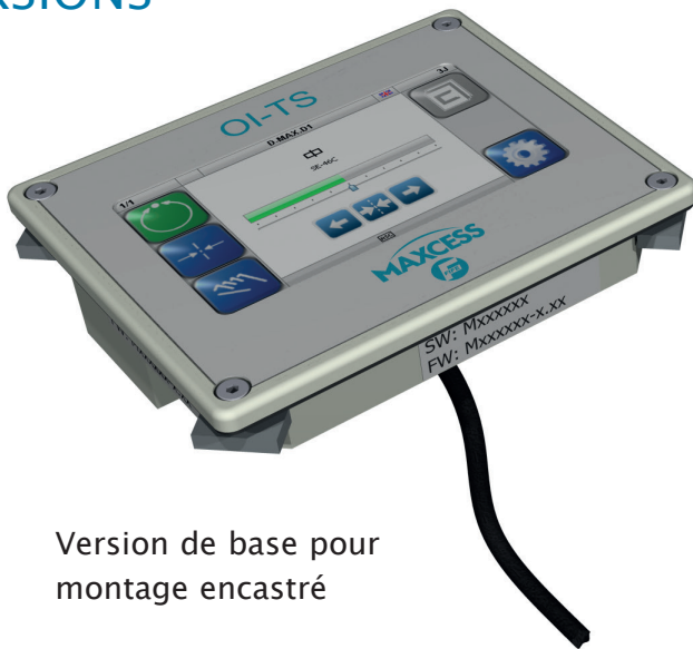
Version de base pour montage encastré